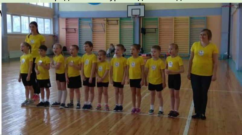
Конкурс фестиваль «Здоровье»