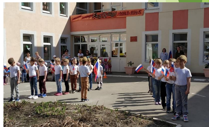
Смотр строя и песни