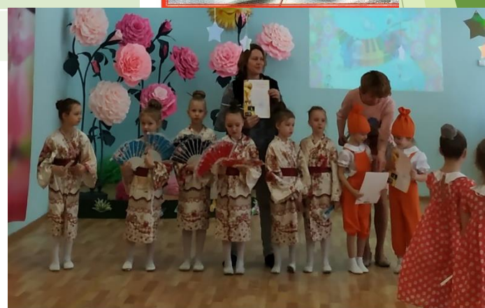
Конкурс районный «Маленькие звездочки»