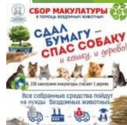
Проект «Сбор макулатуры»