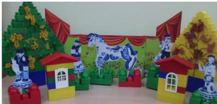
Режиссерская игра «Город мастеров»