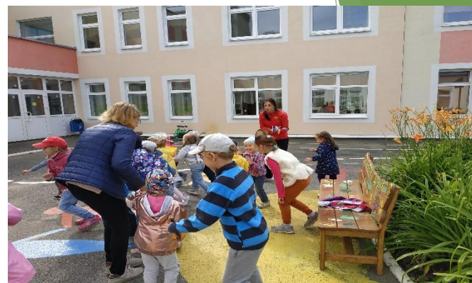
День подвижных игр